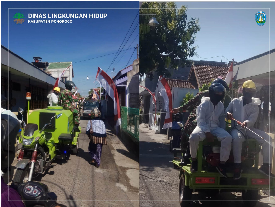
Penyemprotan Dijalan-jalan Kelurahan