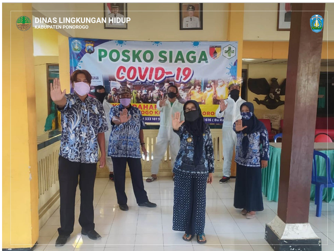
Posko Siaga Covid-19 Kecamatan Kauman

Dari kegiatan ini diharapkan penyebaran virus Covid-19 di kabupaten ponorogo utamanya di kelurahan kauman dapat diminimalisir dan dapat dihilangkan. Tetap jaga kesehatan dan patuhi Protokol Kesehatan._hbp