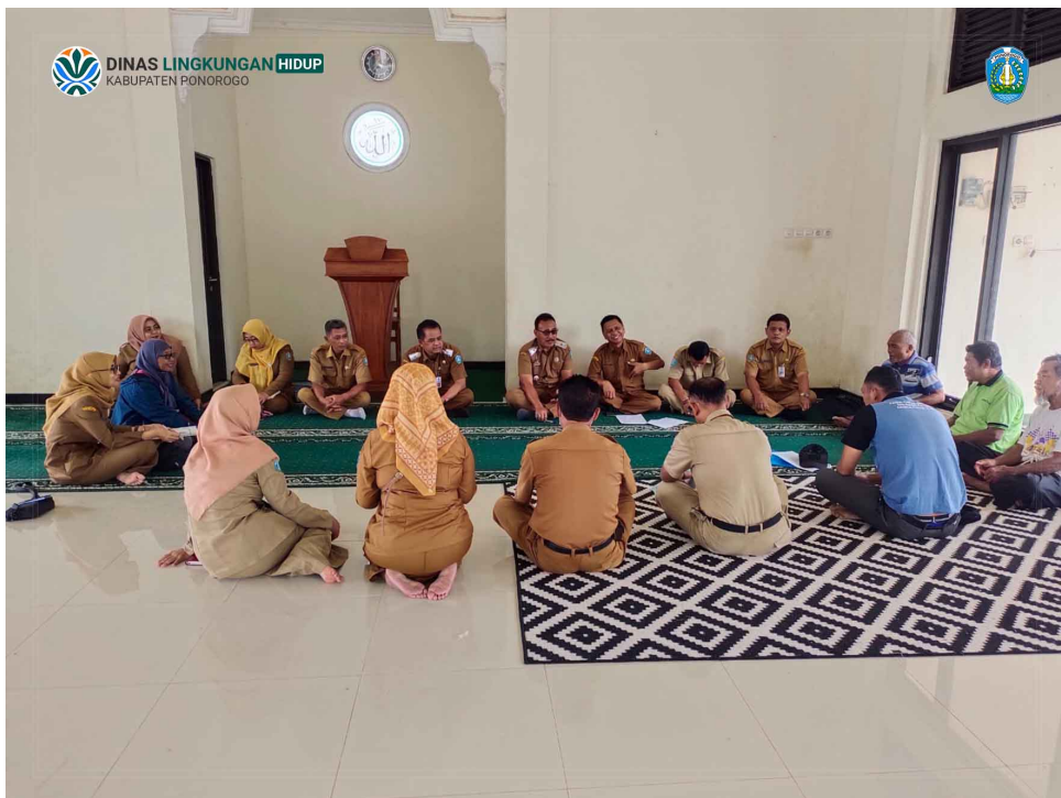
Rapat Koordinasi Penghijauan