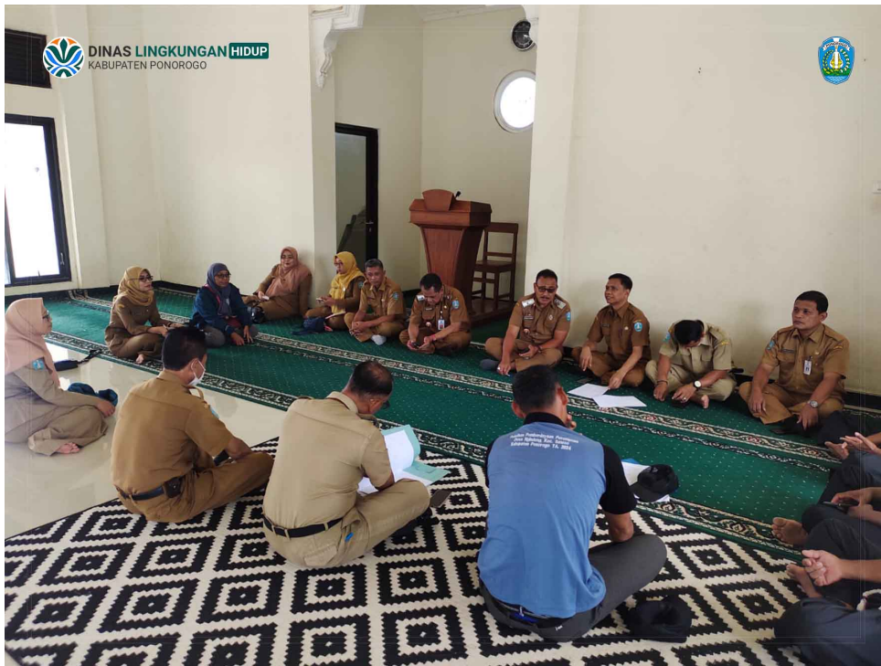
Rapat Koordinasi Penghijauan