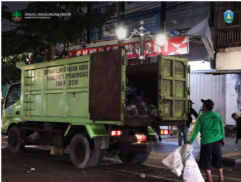
Pengangkutan Sampah Kurang Lebih 2 (dua) Dum Truk