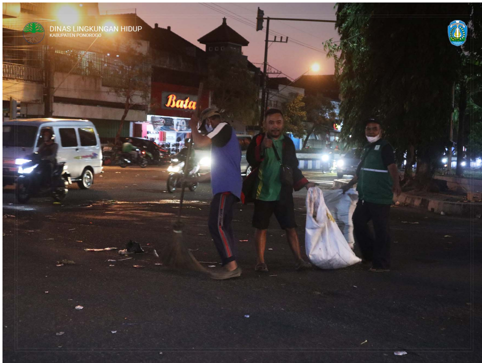
Penegak Kebersihan Melaksanakan Aksinya