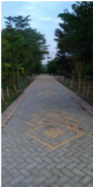
Foto 1 Potret Jogging Track di Taman Keanekaragaman Hayati

Kali ini Taman Keanekaragaman Hayati sudah ada jogging track dengan fasilitas ini diharapkan selain pusat studi terdapat spot untuk berolahraga untuk meningkatkan kualitas kesehatan.